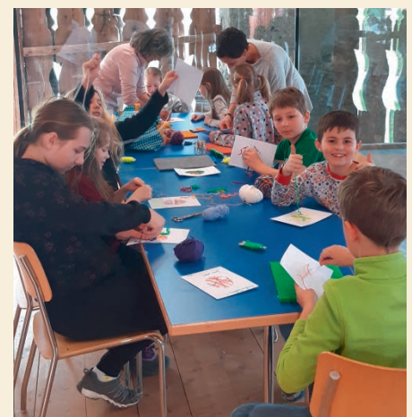
Impression vom Osterbasteln im StALL für ALL.

Nach dem erfolgreichen Osternestli basteln vom letzten Jahr, trafen sich dieses Jahr am Karsamstag 20 Kinder, z. T. von ihren Eltern begleitet, zum Gestalten von Ostergrusskarten im StALL für ALL Tomils. Es wurde geschnitten, geklebt, gezeichnet, gemalt und genäht, «was das Zeug hält». Und so entstanden zahlreiche bunte, fantasievolle und wunderschöne, kreative Osterkarten, mit denen die Kinder in ihrem Umfeld zu Ostern Freude verschenken konnten. (ab)