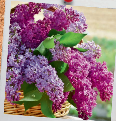
Am 12. Mai ist Muttertag.