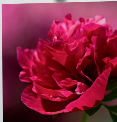
... es rund 40 verschiedene Arten von Pfingstrosen gibt?

Titelbild «Da kam plötzlich vom Himmel her ein Brausen ...» (Apg 2,1).